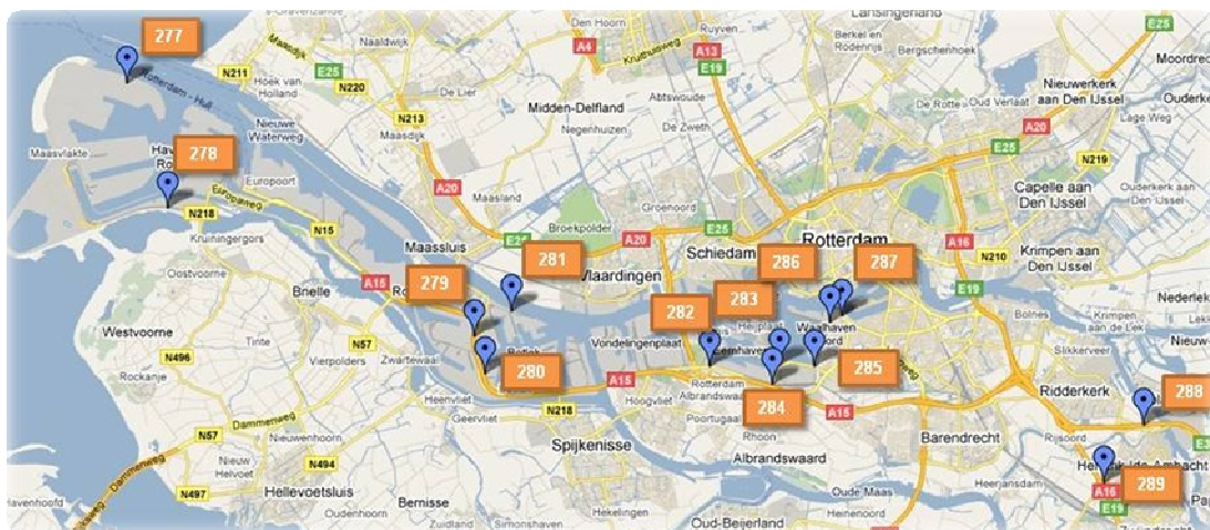
Figuur 2.1: Overzicht locaties van Bluetooth detectoren.

Rond de locaties 283, 284, 285, 286 en 287 bij de waalhaven waren LPR camera's beschikbaar om gemeten reistijden te kunnen vergelijken.