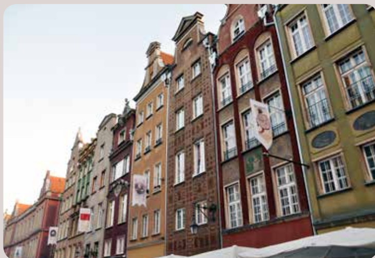
Als toerist kies ik voor Gdansk