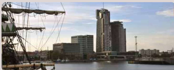
Als professional kies ik voor Gdynia