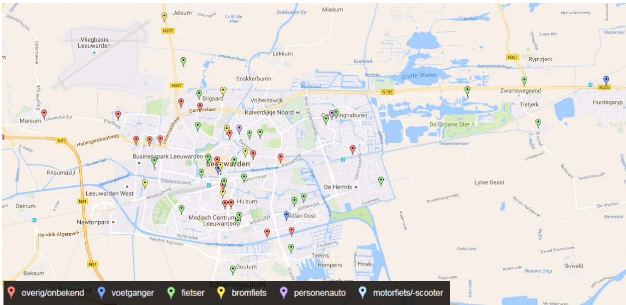
Figuur 4.3 Kaart met exacte verkeersongevalslocaties in Leeuwarden, naar type verkeersdeelnemer