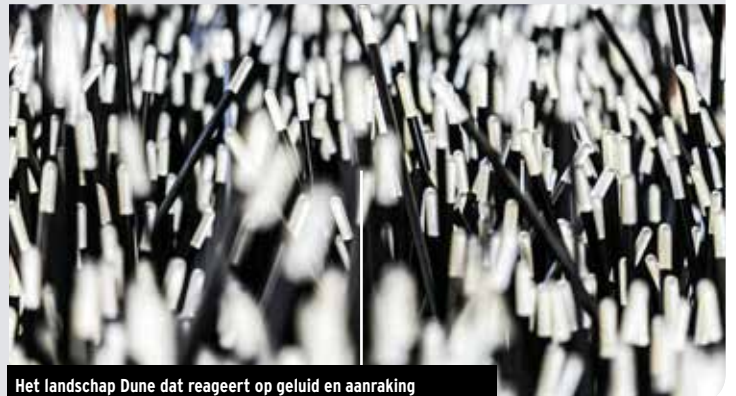
Het landschap Dune dat reageert op geluid en aanraking

omgevingen met korte bewegingen herinrichten. Plekken waar mensen snel weer doorgaan maar zich toch heel even thuis voelen, zoals een Centraal Station.