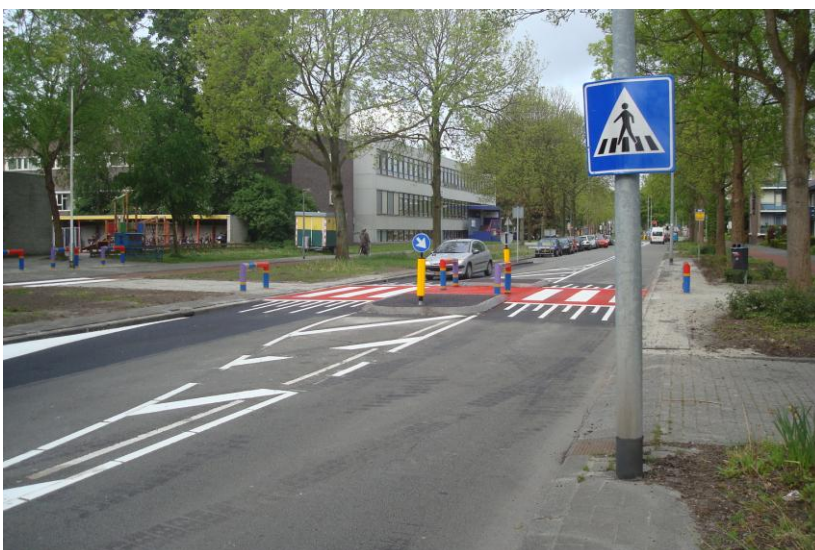
Foto 2: Veilige schoolomgeving door zebra-pad over gebiedsontsluitingsweg op plateau met rode markering en regenboogpaaltjes