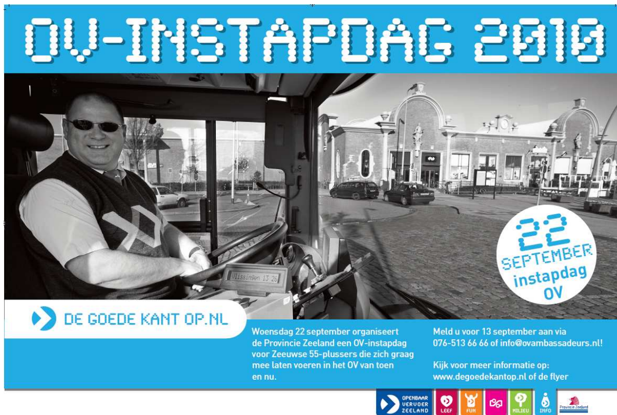
Figuur 1: Programma OV-instapdag